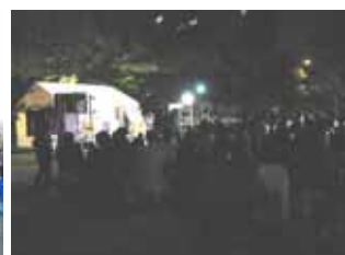
北大江公園ライブの様子(10/23)