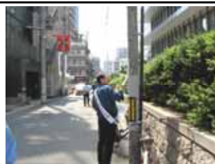
5月13日石町張り紙撤去