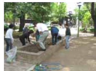
5月15日高倉筋花壇の花植え