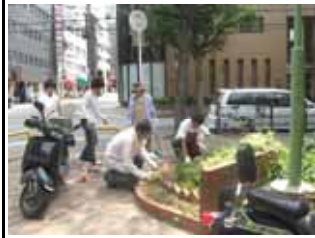
8月21日善安筋花壇の花植え