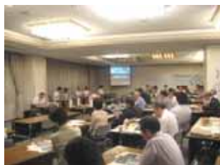
フォーラムの様子

花と緑の北大江公園づくり(北大江公園を核とする花と緑のまちづくり活動) ・毎月第 3 金曜日に北大江公園、島町プランター周りの清掃と花植え、草取り、等を実施 ・北大江公園および島町沿いプランターの維持管理(水やり等)を実施(毎日)