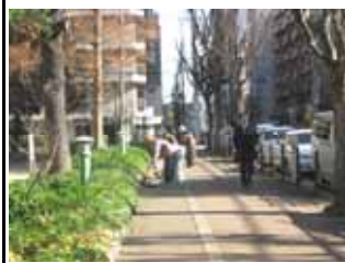
12月18日島町沿いの清掃