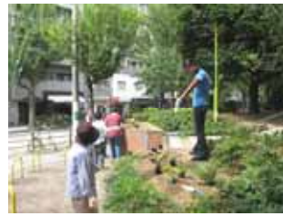
9月18日御祓筋花壇の花植え