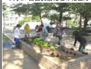
10月16日高倉筋花壇の花植え