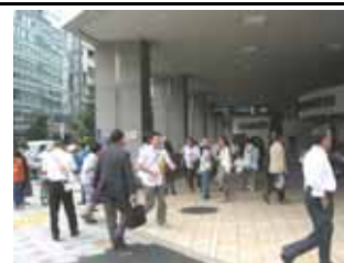
9月9日天満橋駅付近啓発活動