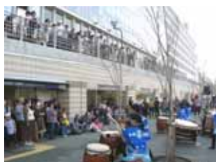
八軒家浜ライブの様子(10/18)