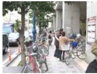
1月13日天満橋駅前啓発活動