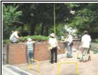
6月19日御祓筋花壇の花植え