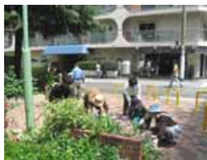
4月17日善安筋花壇の花植え