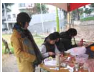
「あったか北大江まち祭り」の様子