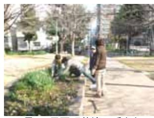
1月15日石町花壇の手入れ