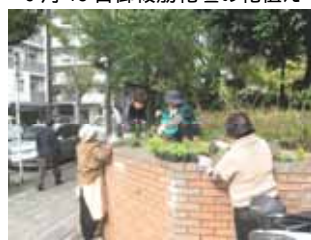
11月20日御祓筋花壇の花植え