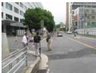
フィールドワークの様子