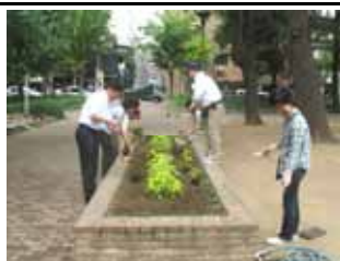
7月17日高倉筋花壇の花植え