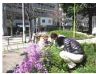
3月19日御祓筋花壇の手入れ