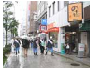
3月10日谷町付近啓発活動