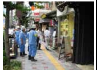
9 月 8 日土佐堀通付近啓発活動