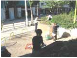
11 月 19 日御祓筋花壇の手入れ