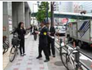
5 月 12 日天満橋駅付近啓発活動