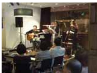
オープニングパーティの様子(10/18)