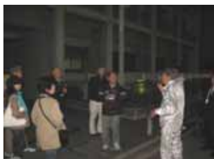
夕方まち点検の様子(11/7)