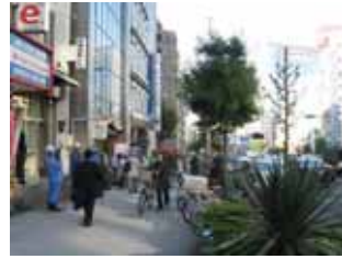
11 月 10 日谷町付近啓発活動