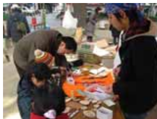
手づくり体験イベントの様子