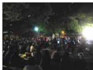
北大江公園ライブの様子(10/22)