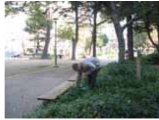
12 月 17 日ベンチ裏のごみ取り