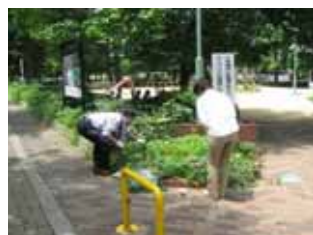
7月16日善安筋花壇の手入れ