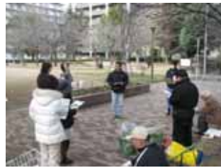
2 月 18 日活動後の花緑部会