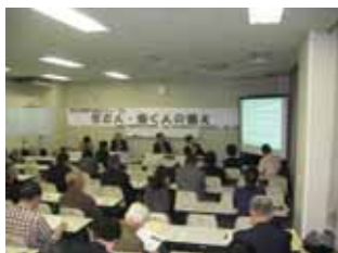
フォーラムの様子(12/6)