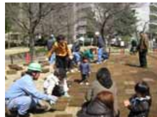
3 月 24 日芝生の植え付け