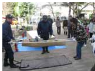
自主防災体験イベントの様子