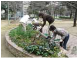
1 月 21 日石町花壇の手入れ