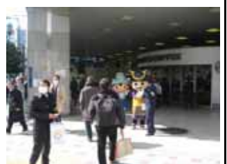
3 月 9 日天満橋駅付近啓発活動