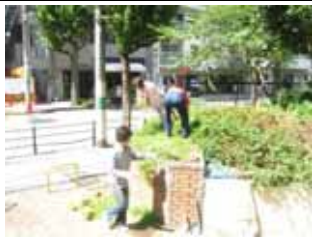
9 月 18 日御祓筋花壇の手入れ