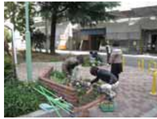
3 月 18 日石町花壇の手入れ