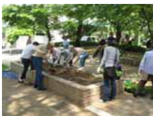
5月21日高倉筋花壇の花植え