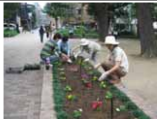
10 月 15 日高倉筋花壇の花植え