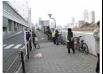
1 月 12 日天満橋付近啓発活動