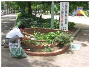
7月19日善安筋花壇の手入れ