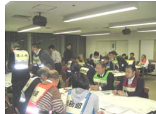
自主防災フォーラム(3/18)