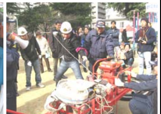
自主防災体験イベントの様子