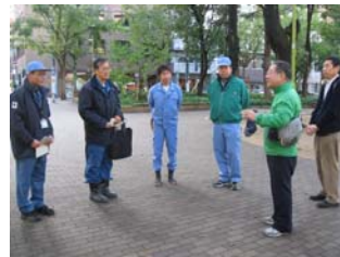
11月15日活動後の花緑部会