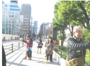
まちづくり 15 周年まち歩き(11/30)