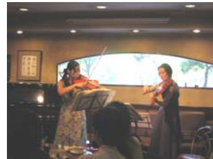
オープニングライブの様子(10/14)