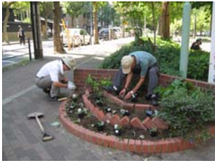
9月20日善安筋花壇の手入れ