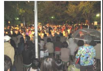
北大江公園ライブの様子(10/18)