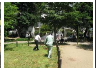
5 月 17 日芝生広場の手入れ