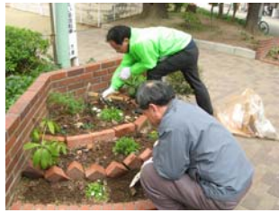
1月17日お祓筋花壇の手入れ