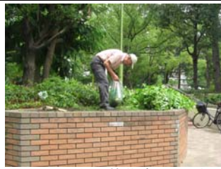
8月23日御祓筋花壇の手入れ