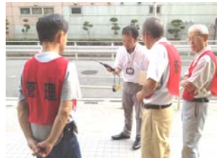
避難所開設実習 at 中央高校(8/8)