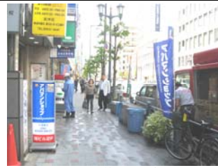
5月8日土佐堀通啓発活動