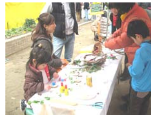
手づくり体験イベントの様子