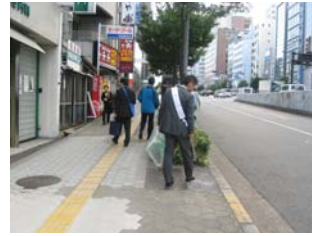
11月14日谷町筋付近啓発活動