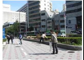
3月13日天満橋付近清掃活動