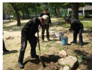
4 月 19 日芝生の種まき