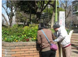
3月14日御祓筋花壇の手入れ