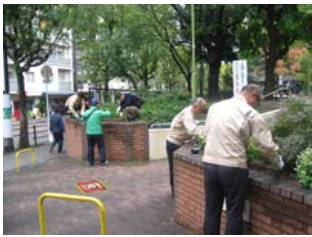
11月15日御祓筋花壇の手入れ