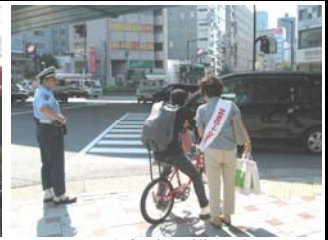
9月11日自転車斜横断防止啓発