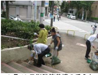
9 月 18 日御祓筋花壇の手入れ