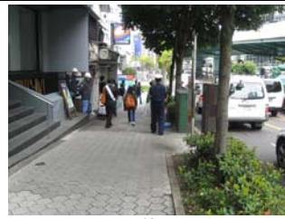
4 月 8 日谷町筋付近啓発活動