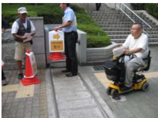
避難所実習 at 大手前高校(8/3)