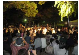
北大江公園ライブの様子(10/16)