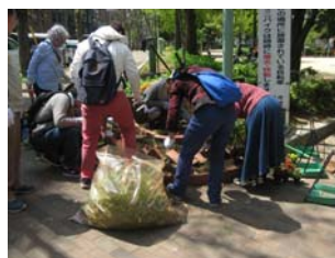
4月17日善安筋花壇の手入れ