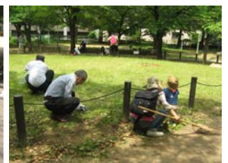
5月15日芝生広場の手入れ