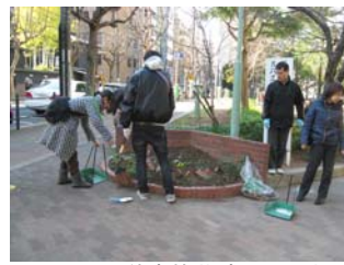
1 月 15 日善安筋花壇の手入れ