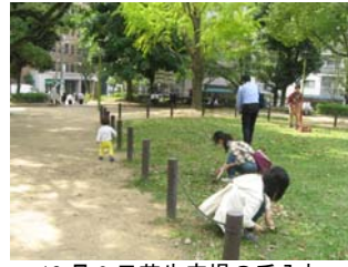
10 月 9 日芝生広場の手入れ