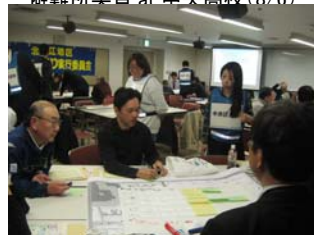
地域防災力向上フォーラム(3/22)