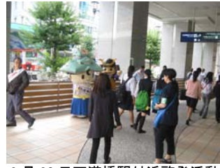
9 月 30 日天満橋駅付近啓発活動