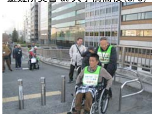
坂道と水辺バリアフリー体験(12/5)