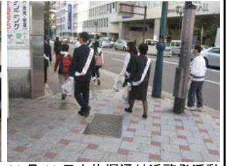
11 月 11 日土佐堀通付近啓発活動