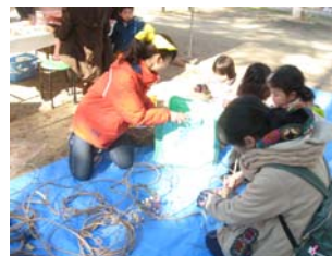
手づくり体験イベントの様子