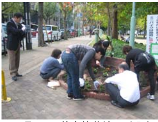
11 月 20 日善安筋花壇の手入れ