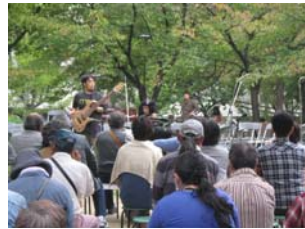
オープニングライブの様子(10/10)