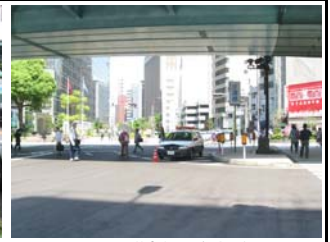
5 月 13 日天満橋交差点啓発活動