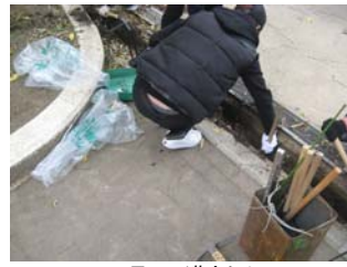
12 月 18 日溝さらえ