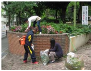
6 月 19 日御祓筋花壇の手入れ