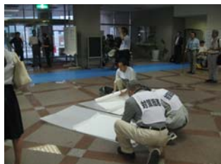
避難所実習 at 中央高校(8/6)