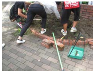
8 月 21 日善安筋花壇の手入れ