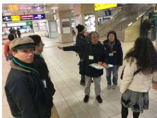
外国人留学生とのまち探索 (1/19)