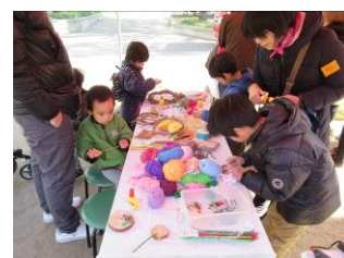
手づくり体験イベントの様子