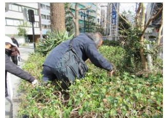
3月13日松屋町筋付近清掃活動