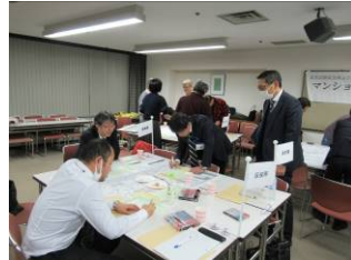
地域防災力向上フォーラム (3/20)