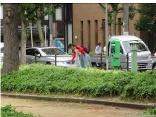
6月15日公園のごみ拾い