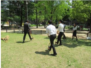
4月18日芝生広場の手入れ