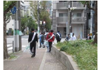
11月14日島町付近啓発活動