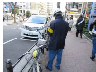
1月9日谷町筋付近啓発活動