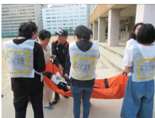
避難所実習 at 大手前高校 (7/17)