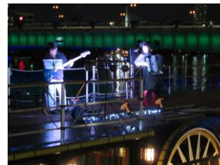
八軒家浜ライブの様子 (10/14)