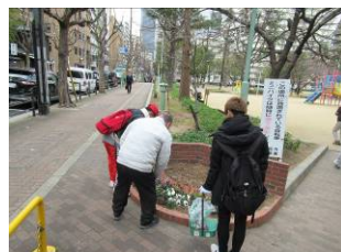
1月18日善安筋花壇の手入れ