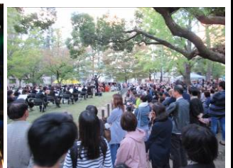
北大江公園ライブの様子 (10/14)