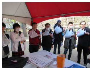
まち祭りでの体験行事 (1/27)