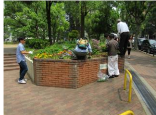
5月19日御祓筋花壇の手入れ