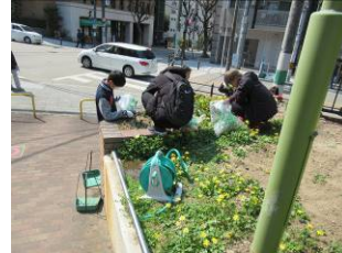
3月15日御祓筋花壇の手入れ