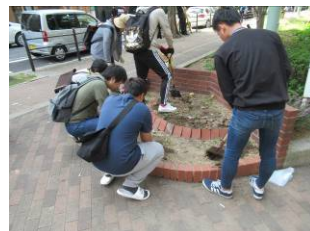
10月19日善安筋花壇の花植え