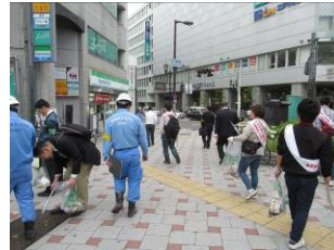
4月11日天満橋付近啓発活動