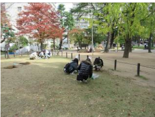
11月16日芝生広場の雑草取り