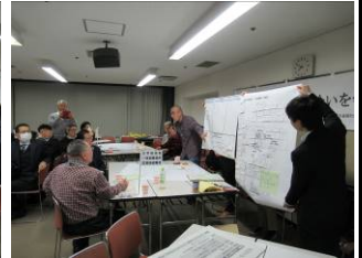
地域防災力向上フォーラム (3/20)