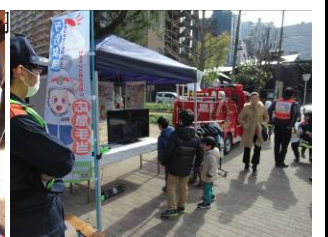
自主防災体験イベントの様子