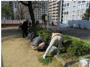
12月17日植込みの雑草取り