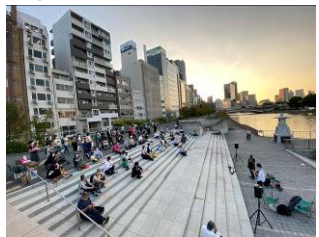
八軒家浜ライブの様子(10/8)