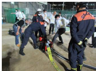
避難場所実習 at 大手前高校(7/13)