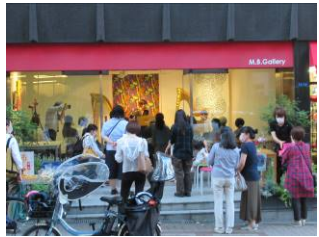
島町ライブの様子(10/6)