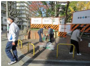
11月19日御祓筋花壇の手入れ