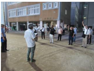
避難場所実習 at 大手前高校(7/13)