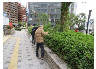
12月8日天神橋付近清掃活動