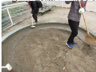
12月17日砂場の手入れ