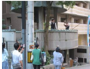
釣鐘屋敷ライブの様子(10/5)