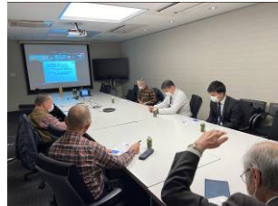
地域防災力向上フォーラム(3/4)