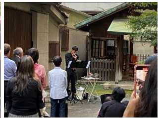
坐摩行宮ライブの様子(10/4)