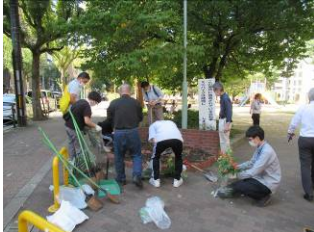
10月15日善安筋花壇の手入れ