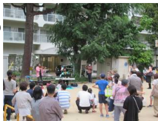
北大江公園ライブの様子(10/7)