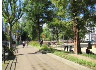
10月15日島町足元灯の清掃