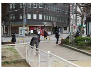
1月21日善安筋花壇の手入れ