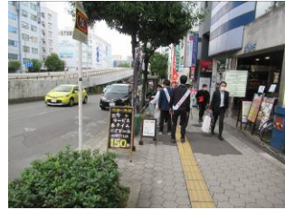
11月10日谷町筋付近啓発活動