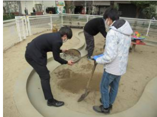
1月21日砂場の砂ふるい