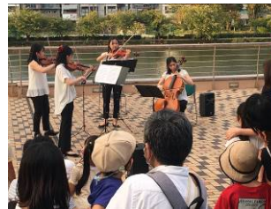
八軒家浜ライブの様子(10/2)