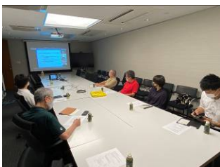
避難場所実習 for 中央高校(8/26)