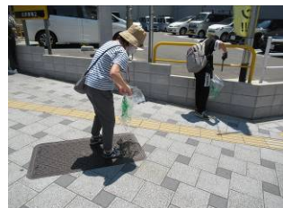
6月9日土佐堀通付近清掃活動