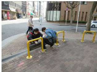
11月19日善安筋入口の溝さらえ