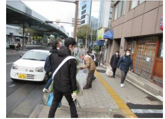
1月13日谷町筋付近清掃活動